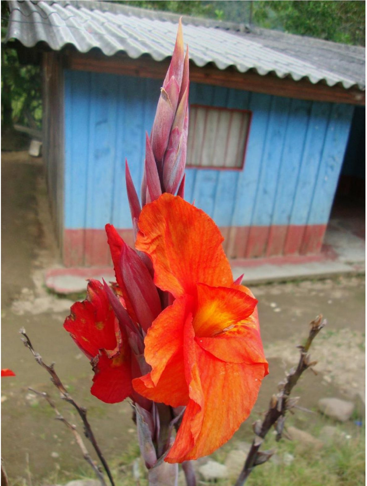
Sandra Isabel Payan —Coconuco, Colombia