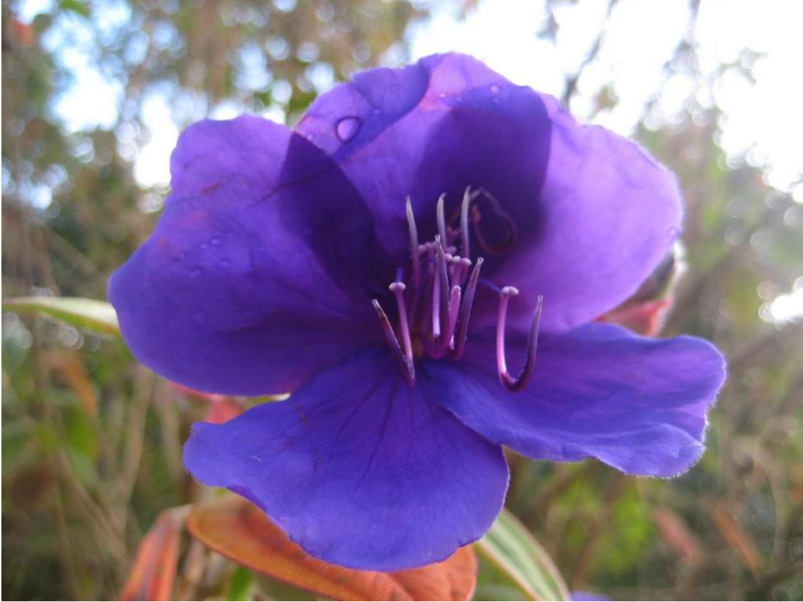
Sandra Isabel Payan —Colombia