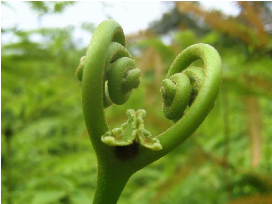
Sandra Isabel Payan –Cali, Colombia