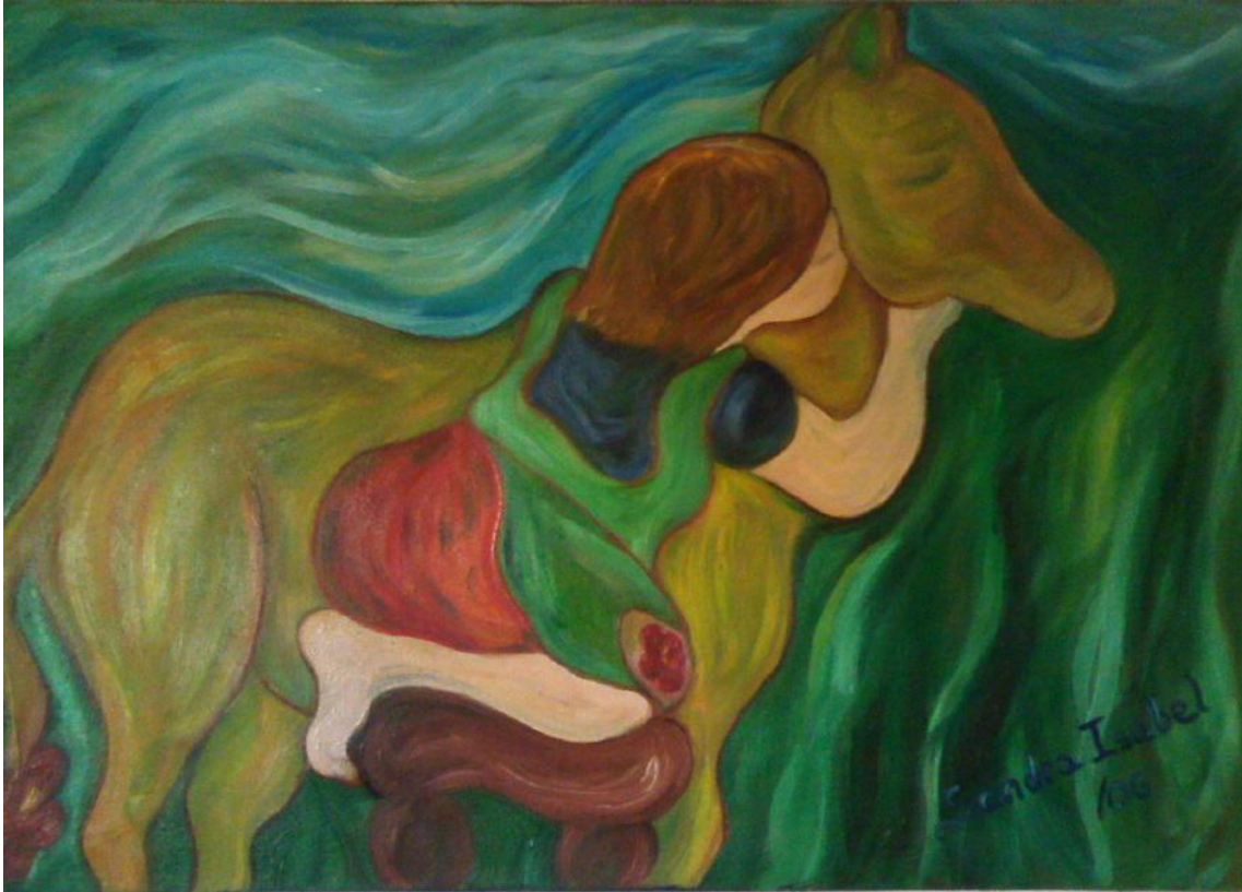
Sandra Isabel Payan - Cali, Colombia